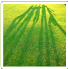
Die Glücklichen sind dankbar. Die Dankbaren sind glücklich. Bruder David Steindl-Rast