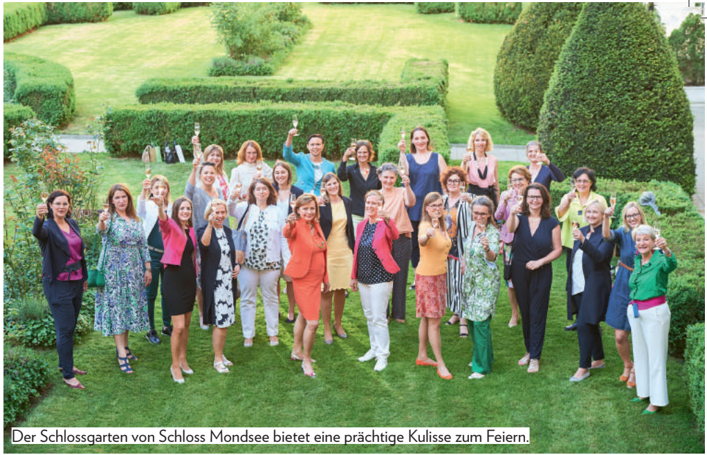
Der Schlossgarten von Schloss Mondsee bietet eine prächtige Kulisse zum Feiern.