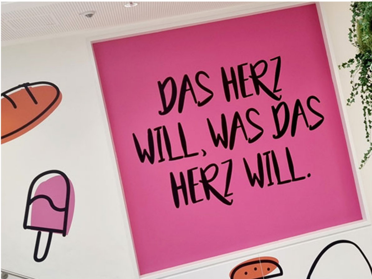
Fundstück in der Linzerie, 1. Stock.