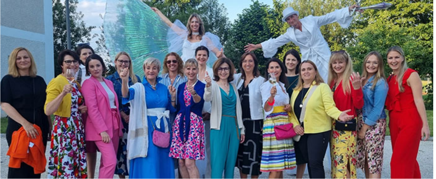
Mit den Teilnehmerinnen von frauen.fortschritt.finanzen beim Sommerfest in Eferding.